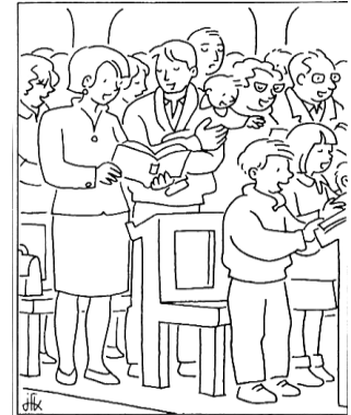
Nous accueillons les Petits Baptisés de juin 2021

Ce dimanche 9 mai, 6 e de Pâques, l'Œuvre d'Orient invite tous les fidèles à prier en communion avec les Chrétiens d'Orient. Au long du temps de Pâques, la lecture des Actes des Apôtres rappelle l'origine orientale de la communauté chrétienne. En France même, nous gardons la mémoire de chrétiens d'Orient, venus annoncer l'Evangile jusqu'en Occident. « Chrétiens orientaux, syriaques, coptes, maronites, grec-melkites, gréco-catholiques, roumains et ukrainiens, éthiopiens, érythréens, syro-malankars, syro-malabars, chaldéens, arméniens ... et latins rassemblés dans la prière » - souligne l'œuvre française qui soutient les Églises orientales depuis 1856.